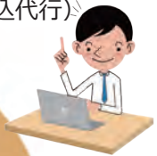
参加者側の グループ管理者 (申込代行)