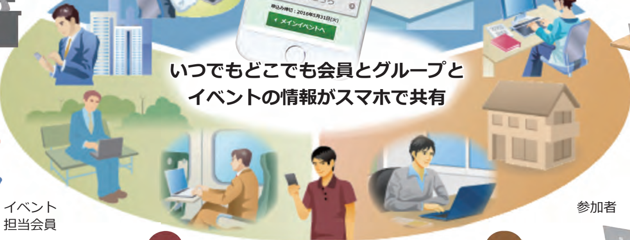
イベント 担当会員